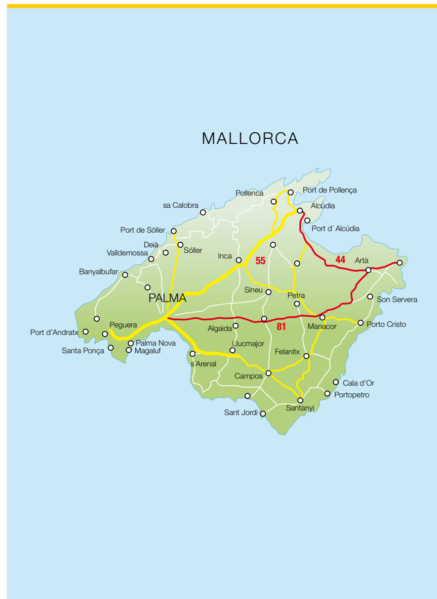
Karta över Mallorca

Spanien är idag en konstitutionell monarki och leds av en regeringschef (Presidente del Gobierno). Regeringschef från 9 juli 2007 är José Luis Rodríguez Zapatero, som är ledare för det Spanska Socialdemokratiska Arbetarpartiet (PSOE). Under Zapateros regeringsperiod har autonomi utökats, samkönade äktenskap legaliserats och abortlagstiftningen skrivits om.