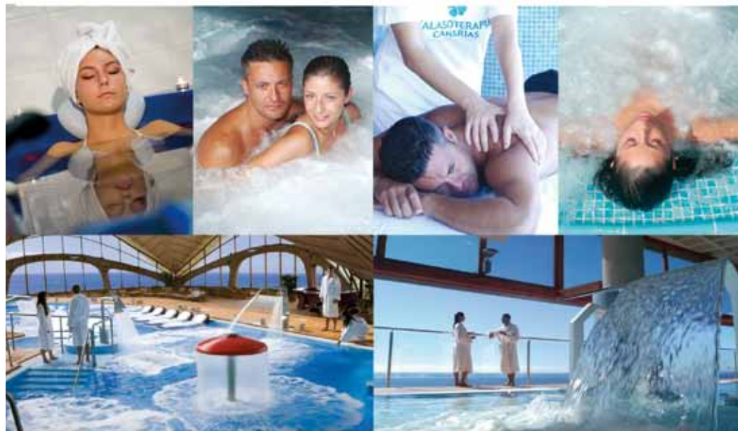
Talasoterapia Canarias San Agustín